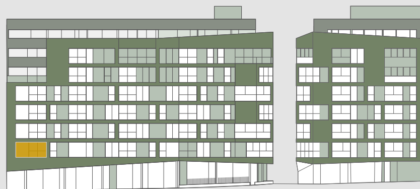
C/ PALOS DE LA FRONTERA